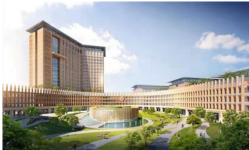
农学院所在的深圳校区医学B楼

农学院以“立德树人为根本，强农兴农为己任”、“农稳社稷，粮安天下”为指导思想，秉持“汇世界精英，育天下英才”的理念，围绕粮食作物高产、优质、高效和学校“双一流”建设的战略发展目标，构建以现代生物技术为主体，融合信息技术和工程技术的新农科，打造具有现代农业、中大特色、世界一流的研究型学院。目前学院拥有生物科学（农学）、农学两个本科专业，生态学一级博士点和农业昆虫与害虫防治二级博士点，植物保护、生态学两个一级硕士点；共建共享有害生物控制与资源利用国家重点实验室和1个毗邻校区的200亩智慧农创园，校区还将建设农业创新科技园。