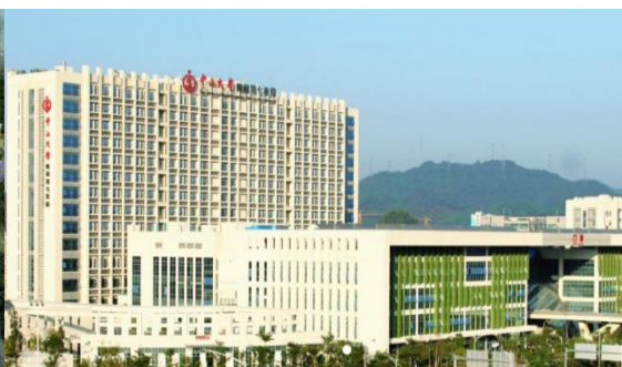
毗邻中大深圳校区的中大附七医院

中山大学农学院源自1909年创建的广东农业讲习所，1924年正式建院。在以第四任院长丁颖教授为代表的老一辈农学家的努力下，为国家培养了一大批农科人才。1952年全国高校调整时，农学院被调出建成华南农学院等，生物学、植物保护和草学仍在中山大学续办。2018年，中山大学立足保障国家粮食安全的战略任务，主动担当，整建制复办农学院，于2019年开始招收本、硕、博学生。