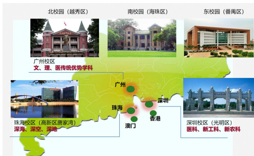
中山大学三校区五校园办学格局

中山大学由孙中山先生于1924年创办，作为教育部直属高校，通过部省共建，已经构建了广州校区、珠海校区、深圳校区三个校区、五个校园及十家附属医院