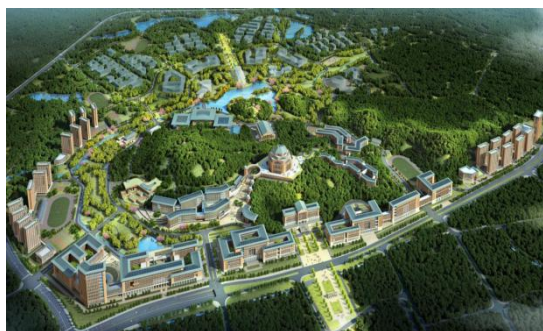
中山大学深圳校区建设效果图