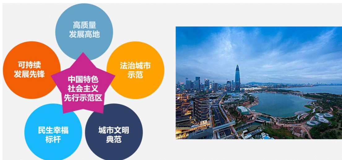
中国特色社会主义先行示范区

中山大学深圳校区是农学院办学所在地，位于深圳市光明区，占地面积约为3.143平方公里，建筑面积约230万平方米。深圳校区紧密契合深圳未来产业发展和创新发展战略进行学科布局，现已设立以医科、新工科、新农科为主体的16个学院和2家附属医院。深圳校区助力深圳市建设粤港澳大湾区和中国特色社会主义先行示范区，坚定不移地推进人才引领发展的城市核心战略，努力把深圳建成天下英才的向往之地和筑梦之城。