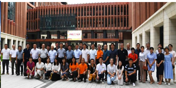
农学院2021年“中国农民丰收节”庆祝大会

中山大学农学院诚邀天下英才，期待有志气、有骨气、有底气、有潜力、有情怀、有抱负的人才加盟，共拓深圳沃土，同创新兴农科，为粤港澳大湾区创新驱动发展、为国家乡村振兴战略、为中山大学农学院的未来携手前进。